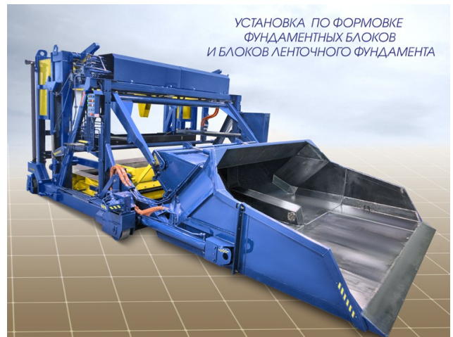
УСТАНОВКА ПО ФОРМОВКЕ ФУНДАМЕНТНЫХ БЛОКОВ И БЛОКОВ ЛЕНТОЧНОГО ФУНДАМЕНТА