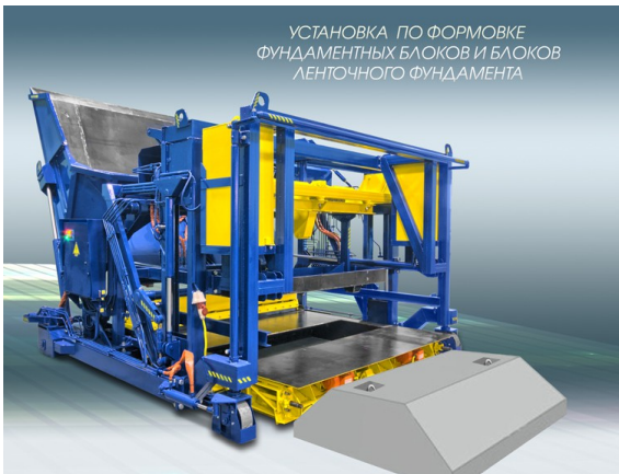
УСТАНОВКА ПО ФОРМОВКЕ ФУНДАМЕНТНЫХ БЛОКОВ И БЛОКОВ ЛЕНТОЧНОГО ФУНДАМЕНТА